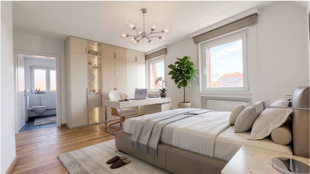
- Modernisierungsvorschlag Schlafen -