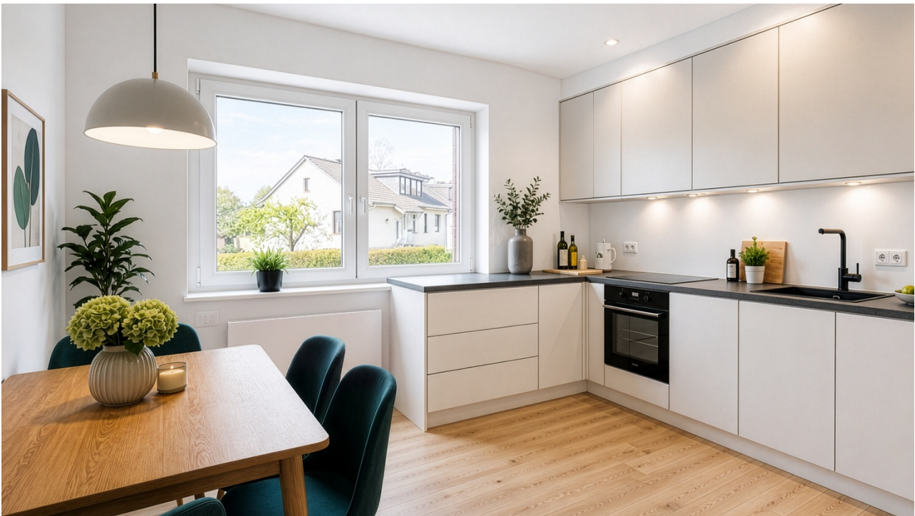
- Modernisierungsvorschlag Wohnküche -