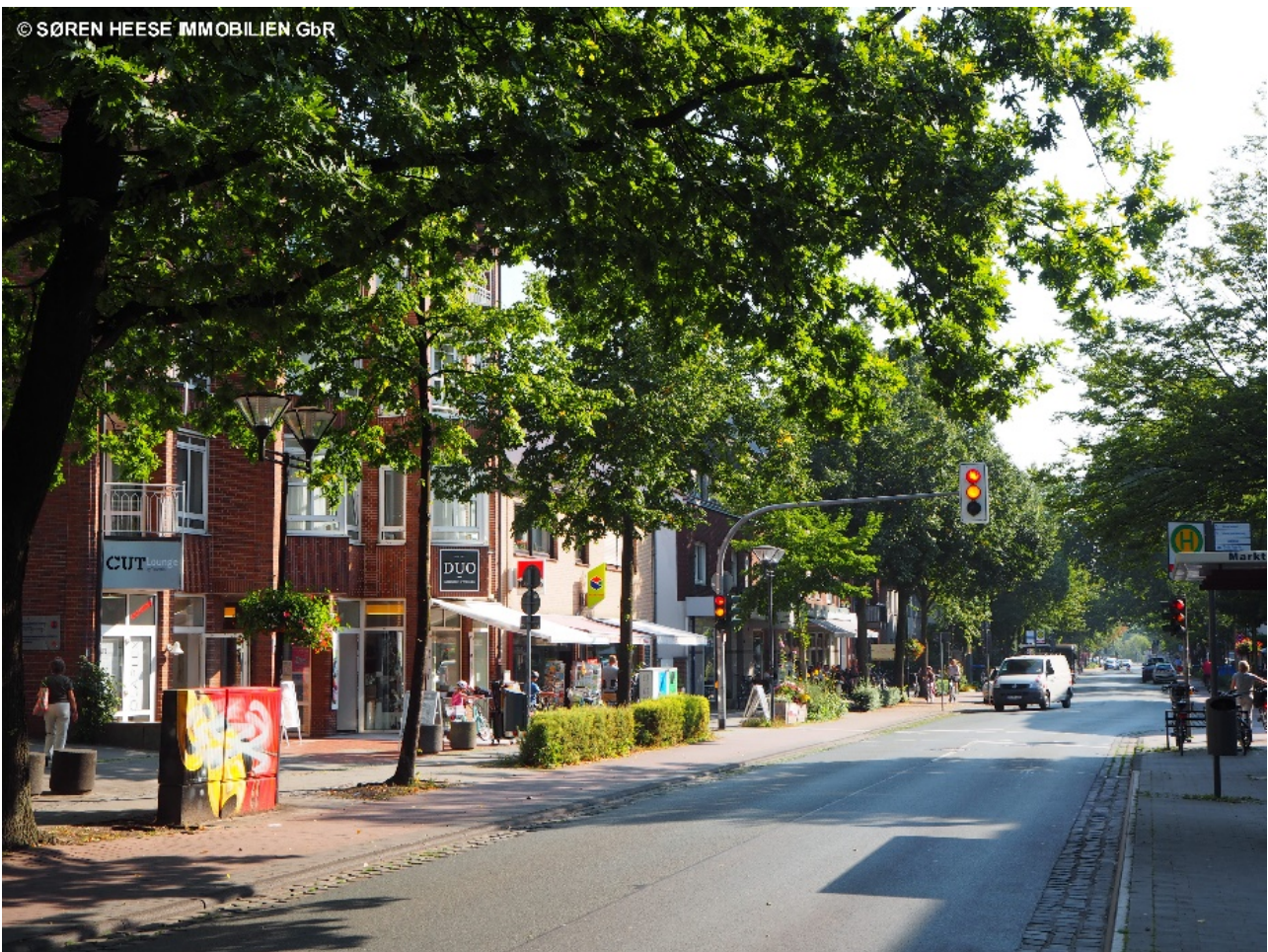
Die beliebte Einkaufsstraße Hilstrup: die Marktallee