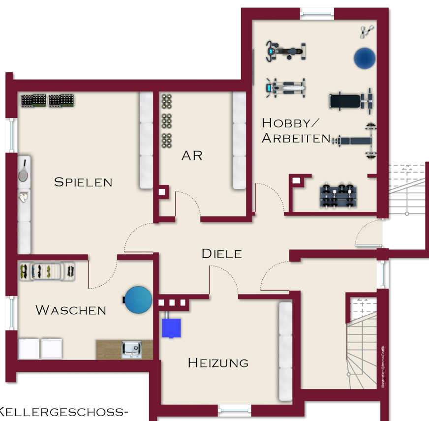
- DAS KELLERGECHOSS -

MÖBLIERUNGSVORSCHLAG: REALVERHÄLTNISSE KÖNNEN ABWEICHEN