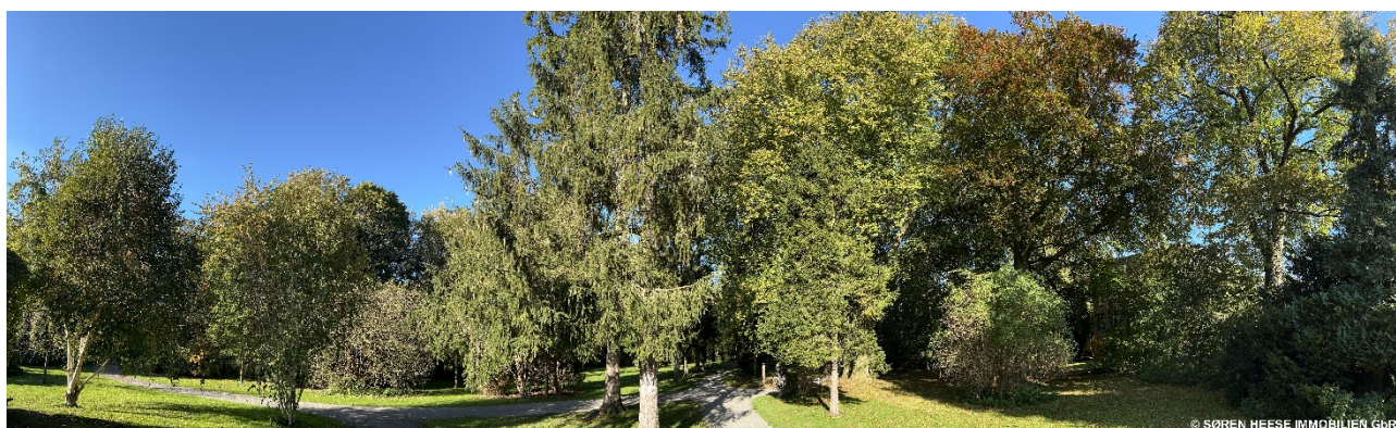
- Die Nachbarschaft: der Stadtspark Sentmaring -