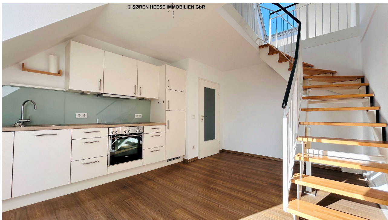
- Bestechend in Licht & Raum: Die Wohnküche -