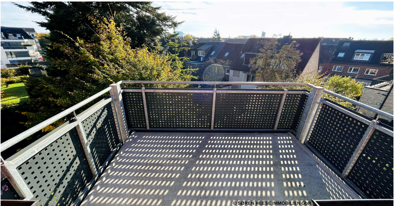
- Die Skyline Münsters: Das Balkonpanorama -