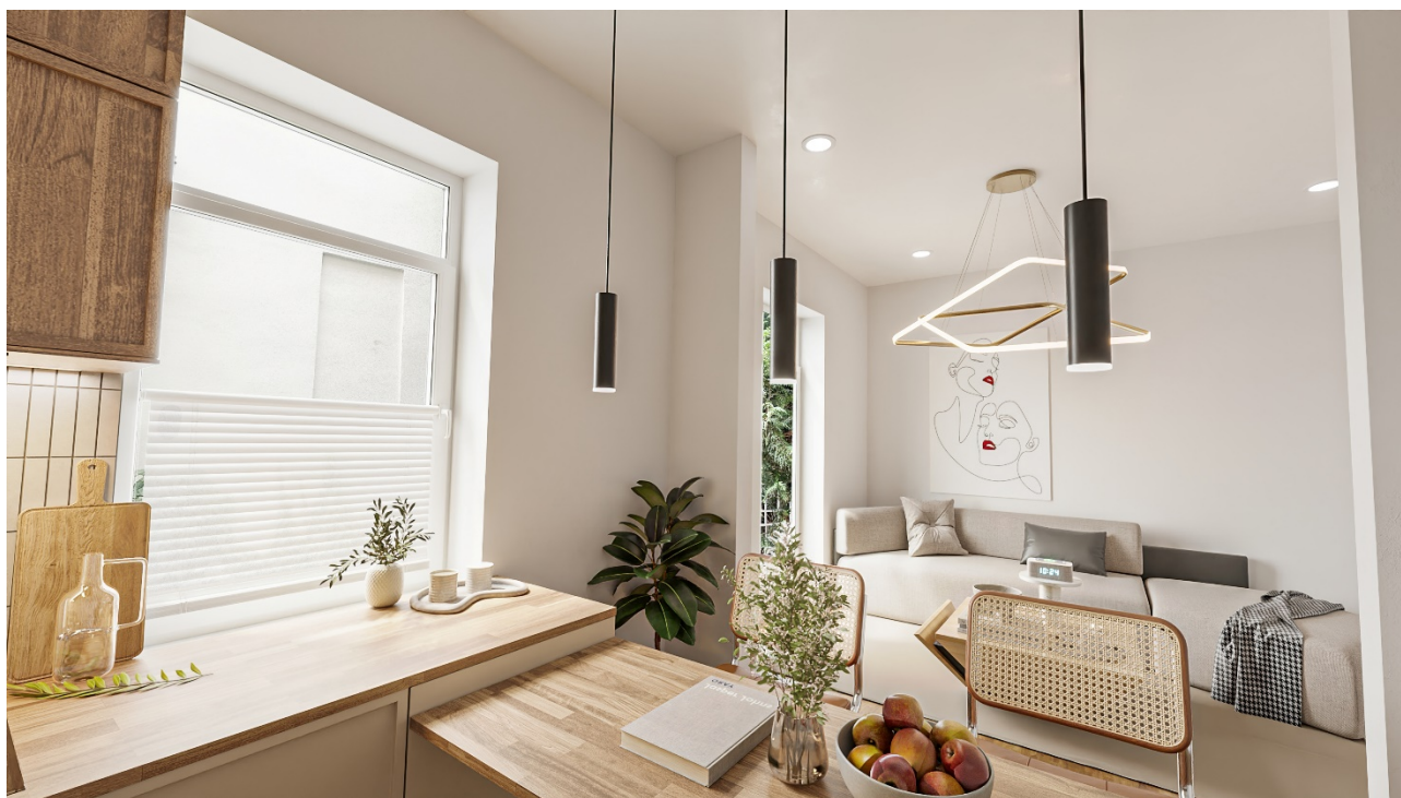
- Möbliervorschlag Gartenwohnung –