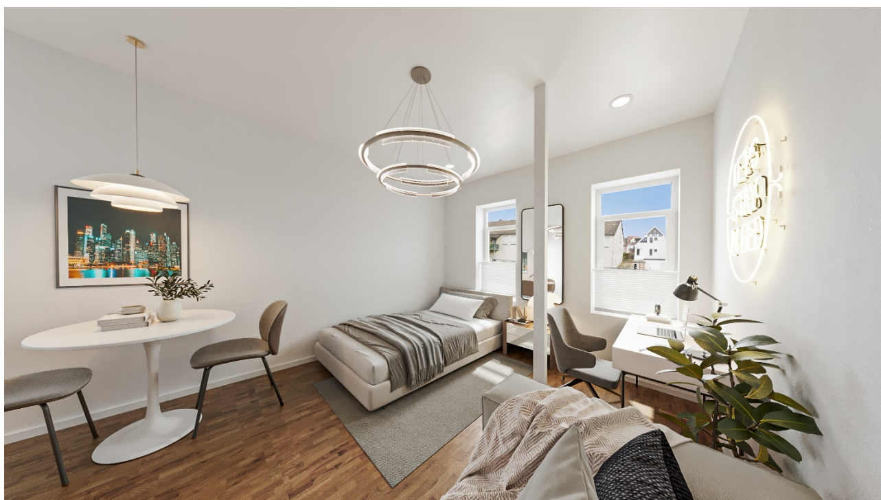
- Möblierungsvorschlag Parterre vorne links -