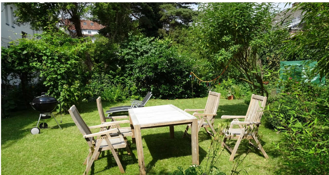
- Gartenimpressionen -