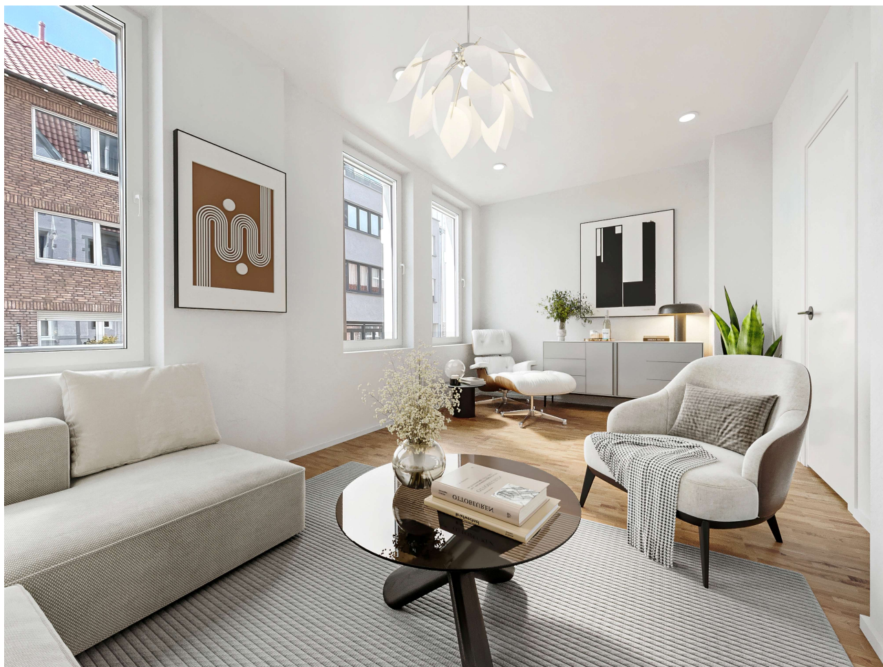
- Möblierungsvorschlag -