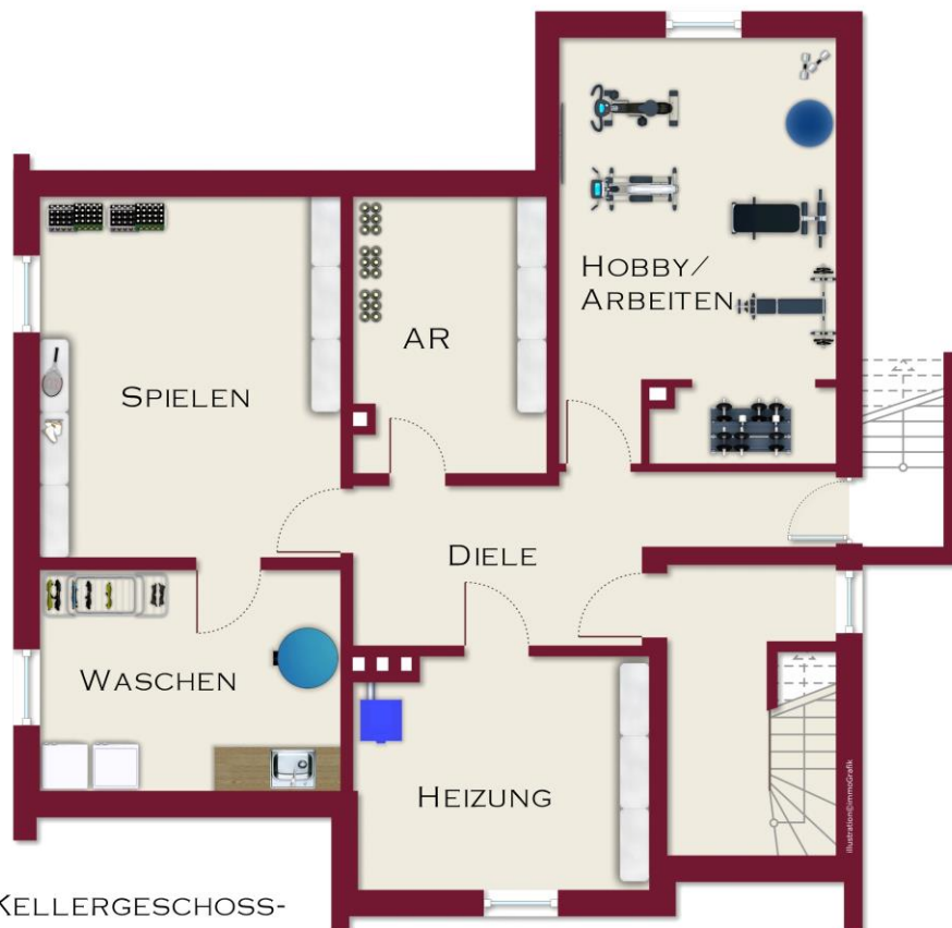
- DAS KELLERGEHOSS-

MÖBLIERUNGSVORSCHLAG: REALVERHÄLTNISS KÖNNEN ABWEICHEN