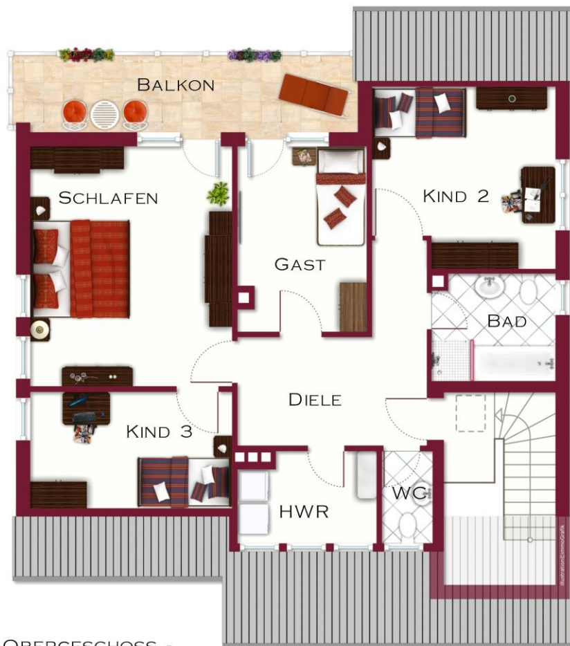
- DAS OBERGESCHOSS -